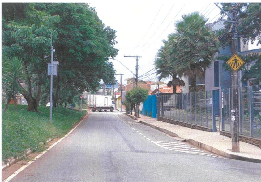
Vista do local.