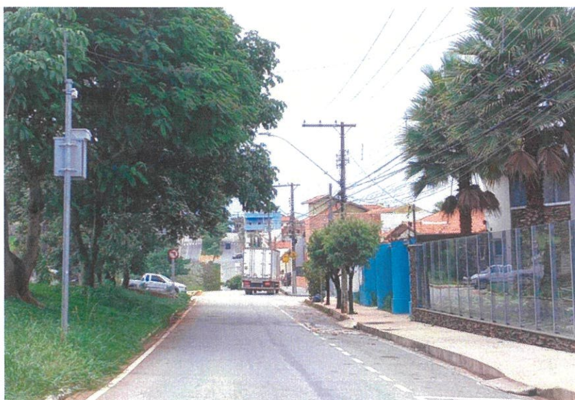
Vista do local.

Praça João Pinheiro, 73 - Centro, Pouso Alegre - MG, 37.550-191